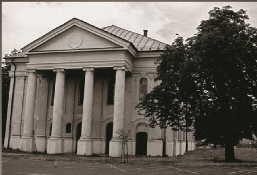
SYNAGÓGA V LIPTOVSKOM MIKULÁŠI