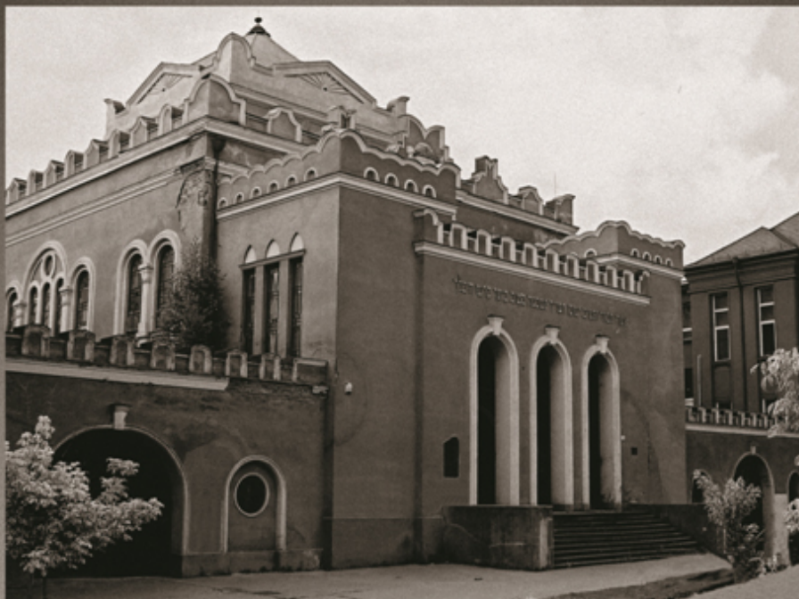
SYNAGÓGA V KOŠICIACH