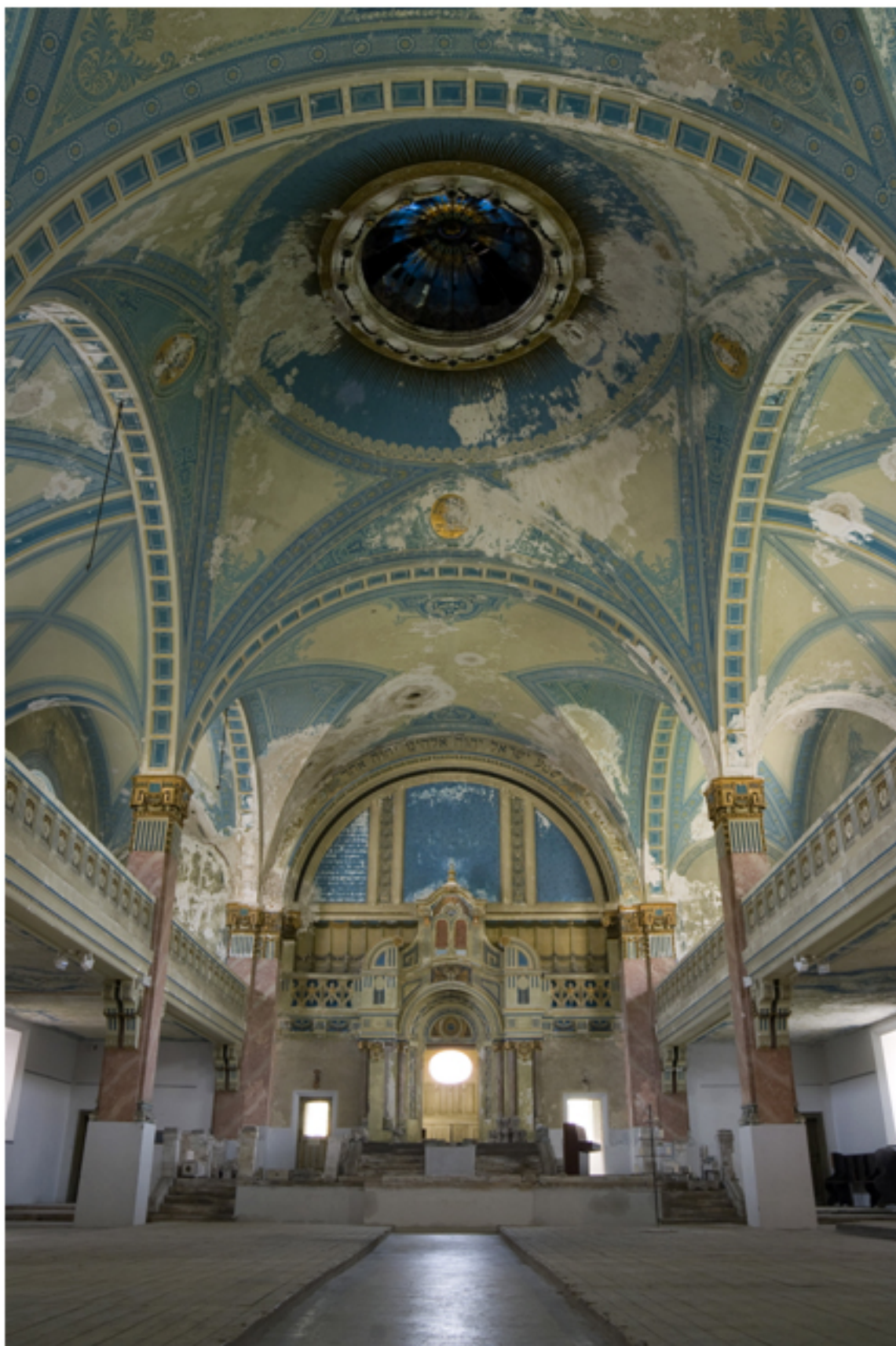
Interiér synagógy v Liptovskom Mikuláši