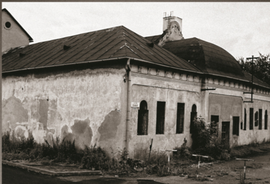
SYNAGÓGA V BARDEJOVE