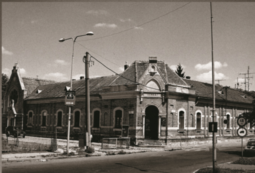
SYNAGÓGA V KOMÁRNE