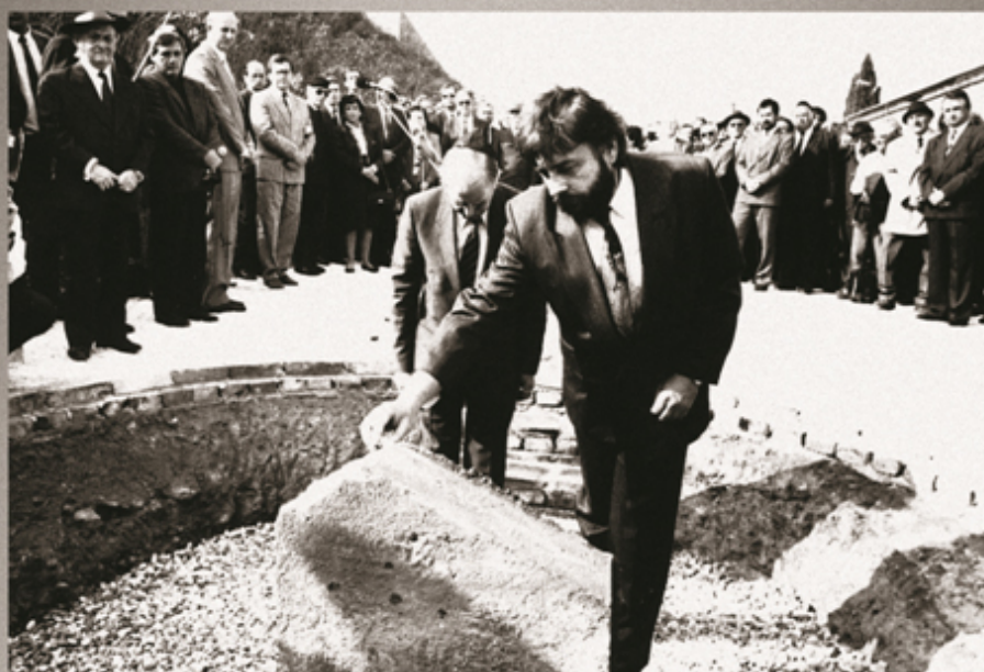
MINISTER KULTÚRY SLOVENSKEJ REPUBLIKY LADISLAV SNOPKO V PRÍTOMNOSTI PREZIDENTA ŠTÁTU IZRAEL CHAIMA HERZOGA ODHAĽUJE ZÁKLADNÝ KAMEŇ PAMÄTNÍKA OBETÍ HOLOKAUSTU NA SLOVENSKU.