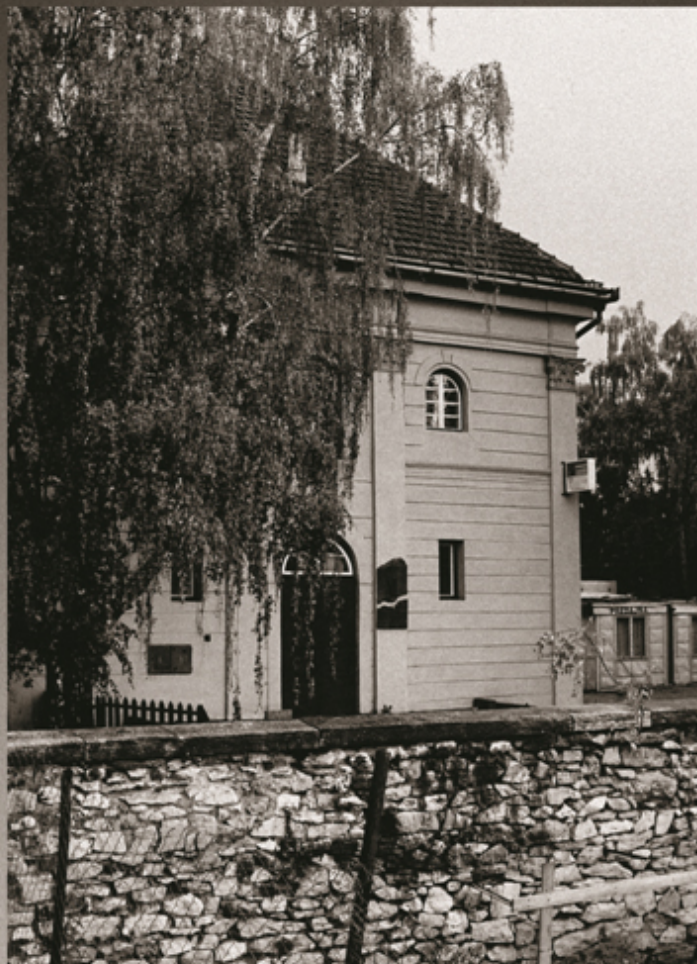
SYNAGÓGA V POPRADE