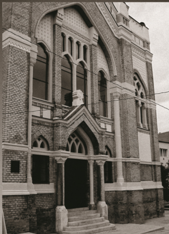
SYNAGÓGA V NITRE