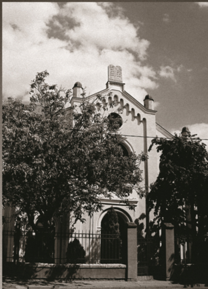
SYNAGÓGA V NOVÝCH ZÁMKOCH